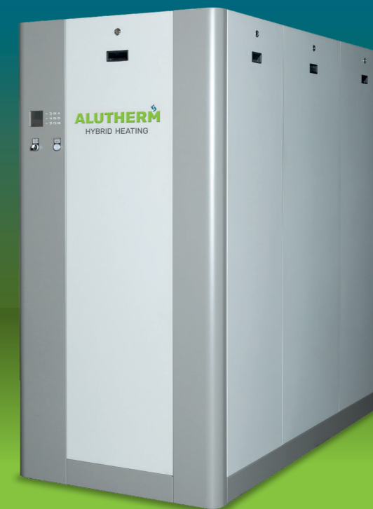
Alutherm C-Serie C850-C1050-C1250