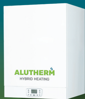
Alutherm A-Serie A90-A115