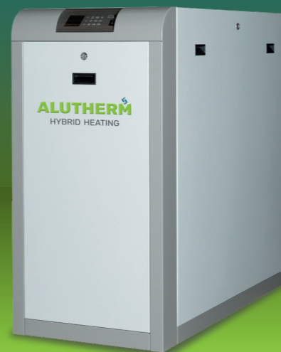
Alutherm A-Serie A170-A300