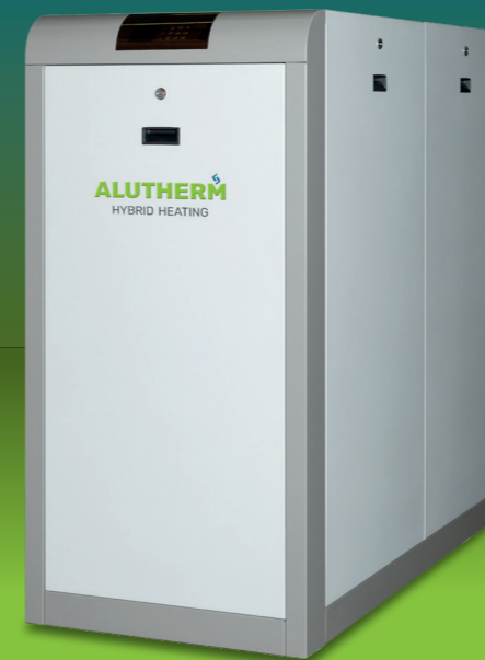
Alutherm B-Serie B350-B600